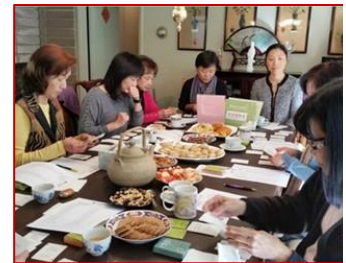
安心茶話屋使用安心卡

Archstone 基金會的卓越項目創新獎是 1997 年起通過捐贈資金設立的年度獎項，用於表揚在老化和公共衛生方面的最佳實踐模範。通過對這些項目的全國性表揚，Archstone 基金會希望這些模範項目能被複製，並繼續受到評估以促進全美長者服務的創新。想瞭解更多安心茶話屋詳情，點擊下載 APHA and Archstone Foundation's 2023 Award Brochure .