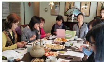
安心茶話屋 (Heart to Heart® Café)

由醫療專業人士，社區領袖以及對事前療護計劃和生命末期議題充滿熱情的個人所組成的志願董事會。