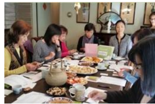
安心茶話屋 (Heart to Heart® Café)

理事會： (9-15 位理事) 由醫療專業人士，社區代表，及認同本聯盟使命的社會人士，所組成的理事會。